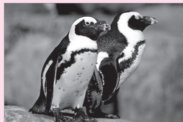
八景島からかわいいケープペンギンがやってくる！